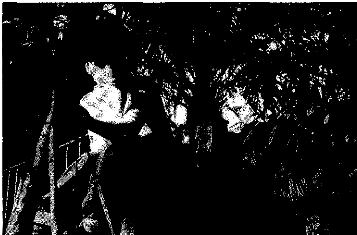
Joan. Centre residencial (Barcelona)