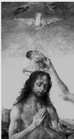
Verrocchio, El Bautismo de Cristo (1472-75)

El Espíritu descendió sobre el Hijo de Dios, que se hizo hijo del hombre, acostumbrándose juntamente con él a permanecer con el género humano, a «descansar» en medio de los hombres y a morar entre aquellos que han sido creados por Dios, poniendo por obra en ellos la voluntad del Padre y renovándolos de forma que se transformen de «hombre viejo» en la novedad de Cristo.